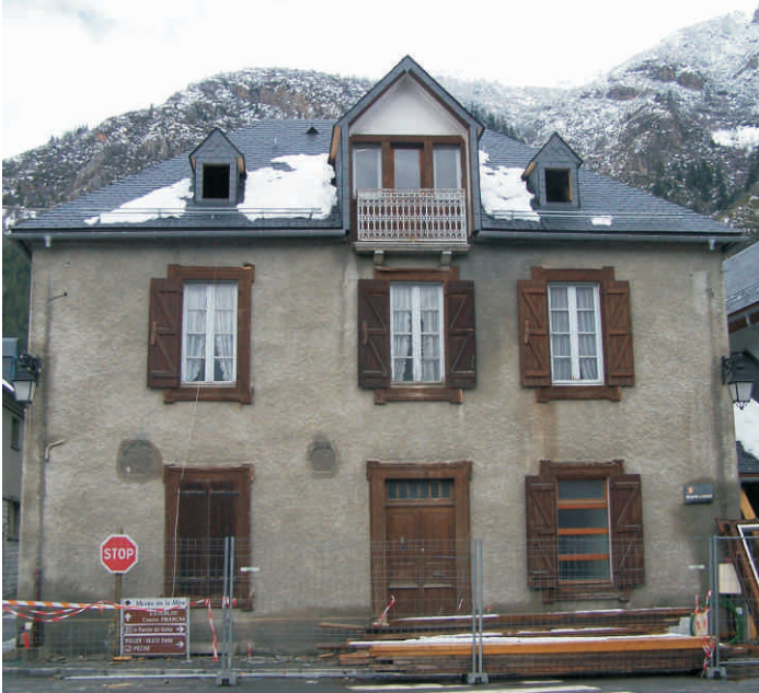
Etat initial - Façade côté route d'Agos